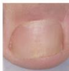
Dopo il trattamento

Le unghie crescono lentamente, pertanto potrebbero volerci dai 2 ai 3 mesi prima di notare un miglioramento.