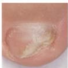
Prima del trattamento

E' importante proseguire il trattamento con lo smalto medicato fino alla completa risoluzione dell'infezione e alla completa rigenerazione dell'unghia. La durata del trattamento dipende dalla gravità e dalla localizzazione dell'infezione. In genere occorrono circa 6 mesi di terapia per le unghie delle mani e da 9 a 12 mesi per le unghie dei piedi. Lei vedrà l'unghia sana ricrescere con il ridursi dell'unghia malata.